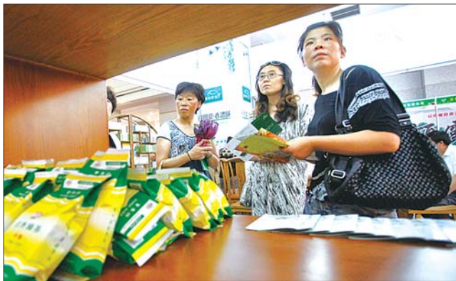
7月20日的日照绿茶节上,市民正在选购茶叶。(资料片)

只是,徐家坪所处地方近似丘陵,且3年以下的茶树不少,致使不少用于越冬防护的防风障及部分冬暖式大棚不同程度摧毁,造成部分损失,初步估算有10多万左右。他们村及时组织人抢修,目前已全部整修完毕。