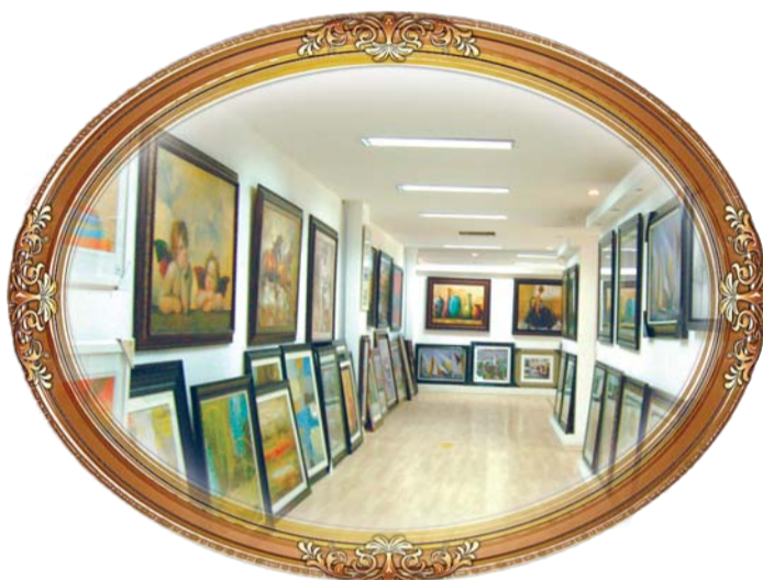
英科环保的产品展厅。

越是在经济危机的时刻,质优价廉的产品越得到人们的青睐。“在美国原来卖500多美元的画框,因为我们的产品出现,类似的画框