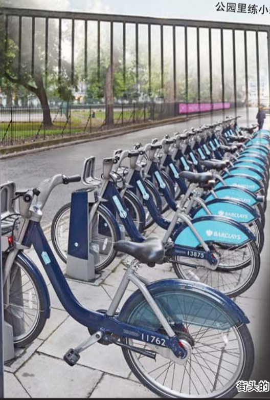
街头的自行车租赁系统,刷银行卡自助租借。