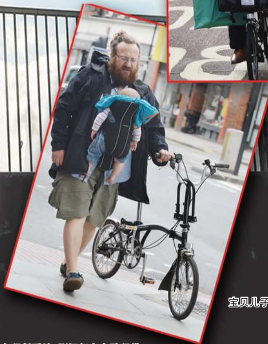
宝贝儿子,宝贝自行车。