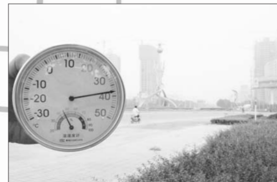
下午2点整,开发区大转盘附近,气温已升至38℃。