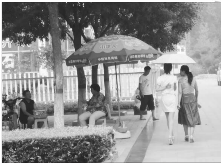
人民公园北侧小道上,人们撑伞遮阳。本报见习记者 郭庆文 摄