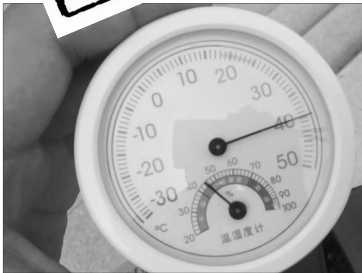
人民广场兴华路入口处气温竟然高达40℃。

三伏天空气湿热,在聊城城区哪里最热,哪里凉快一些?8日下午,本报多路记者集中在一个时间段,随机选取了城区一些区域,调查测试发现人民广场气温竟然高达40℃,而葫芦岛湿地公园、交运大市场才30℃。本次测试的均为室外温度,测试时间为8日下午1点半至2点半,测试结果虽然不一定那么严格,却能从不同角度反映城区各个区域的温度差。测试过程中,记者手持温度计离地1.5米左右,并且尽量避免让阳光直射温度计,测试5到10分钟待温度计数值稳定后读取数据。