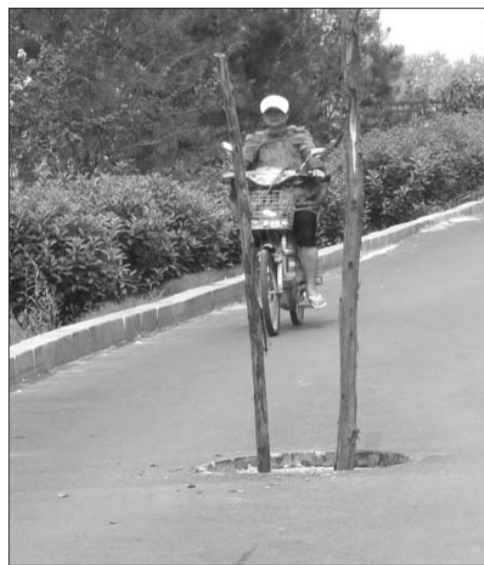
附近好心居民怕路人掉进井里,插了两根木棍当作警示牌。

“原先没有任何警示标志,后来我们家属院一个姓华的老生怕路人不小心掉进去特地找来两根木棍插在那里。”住在附近中医院家属院的居民樊先生说,这个下水道已“张口”近一个月,没有人管。据樊先生说,就在前几天,一名骑三轮车的老人从这里经过时,不小心掉进去,老人挣扎着从下水道里爬上来,腿部明