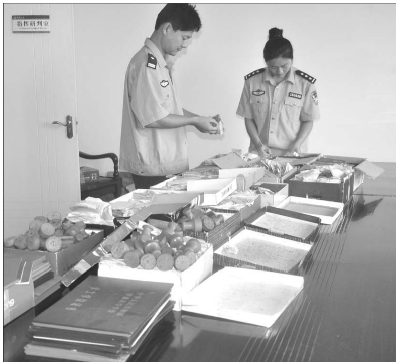
8月8日,办案人员在清理查缴的假证假章。

本报郓城8月8日讯(记者 景佳 通讯员 郎孝文) 郓城县公安局经过三个多月调查,破获一起伪造印章网上制售假证特大案件,该案涉及六省十一市。目前,已抓获犯罪嫌疑人7名,查缴假印章4032枚,身份证、毕业证、房产证等假证件2万余份,收缴赃款38万元,冻结赃款40万元,追缴赃车“比亚迪”轿车一部。