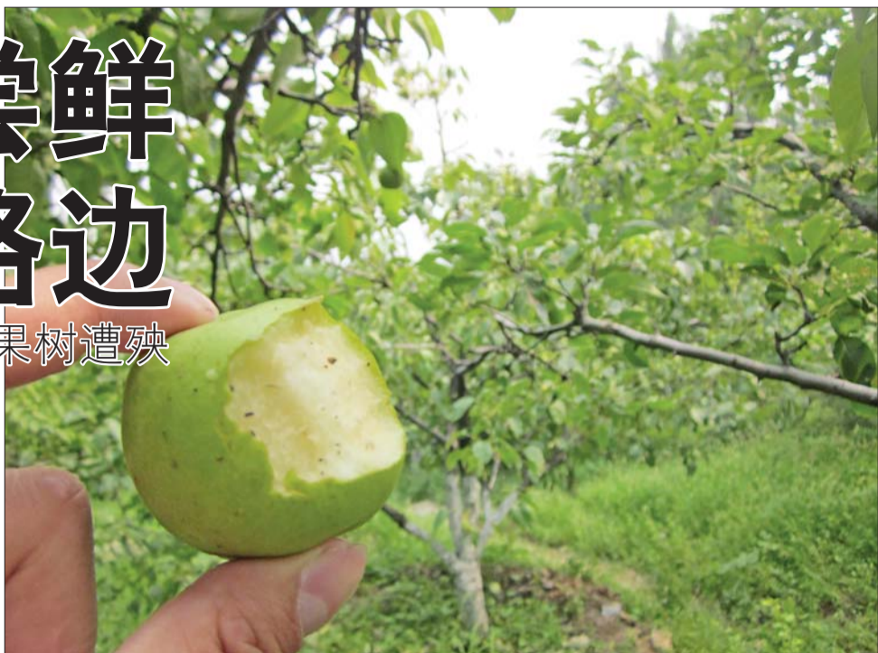
▶在千佛山梨园,一个还不成熟的梨子被人咬了一口就扔了。

为营造景观需要,公园里往往不乏各种果树。记者近日走访市区几个大型公园发现,因为少数市民、游客贪吃,动手偷摘尚未成熟的果子,“硕果累累”的景象难以见到,果树也备受摧残。