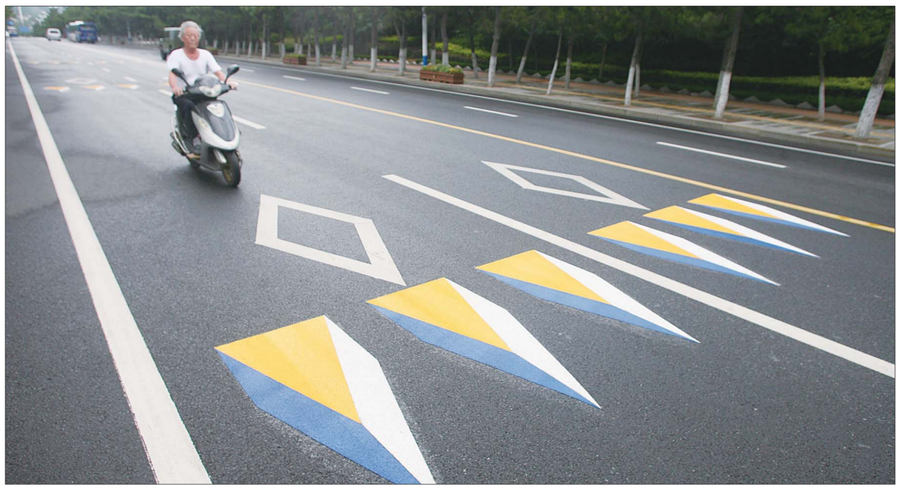
一位骑车市民从环山路上的立体减速带经过。