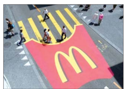
3 斑马线变成了“薯条”