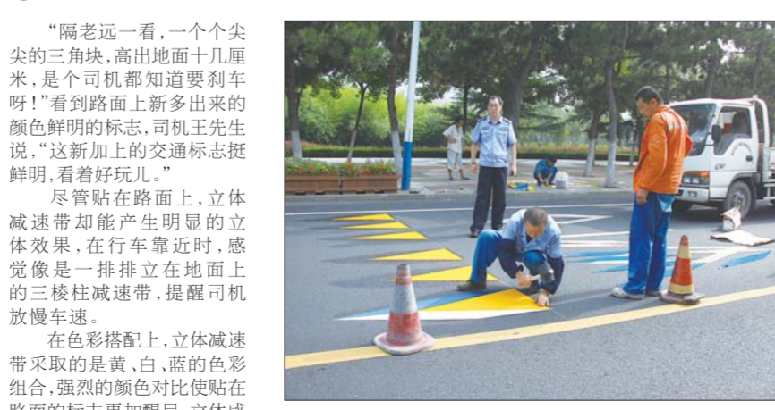
施工人员在贴减速块。