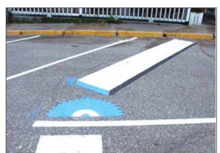
1 斑马线像被锯开的木头