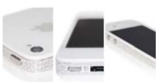
Continental Mobiles iPhone 4S

如果你舍得花1.1万美元买一部iPhone,这款镶钻iPhone 4S肯定能吸引你的眼球。另外,它的外壳还镶有手感最佳的铂金。 售价:1.09万美元