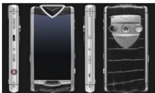
Vertu Constellation T

这是Vertu公司首款3.5英寸触摸屏智能手机,采用塞班系统,毕竟Vertu曾经属于诺基亚。价格取决于具体配置。 售价:6000至1.6万美元