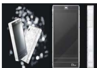
迪奥Reveries Haute Couture

这款手机也搭载Android平台,并获得了LG的很多帮助。外壳镶有99颗钻石和珍珠。 售价:10.7万美元