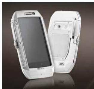
Tag Heuer Link

这款手机覆盖了1007颗钻石,总重2.53克拉,采用Android系统,配备3.5英寸WVGA屏幕和500万像素主摄像头,而且防水、防震,采用瑞士工艺。 售价:按需定制,无钻石版起价6700美元