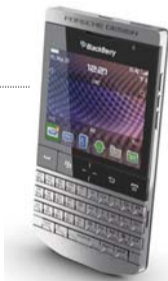
黑莓P'9981 Porsche Design

如果你买不起保时捷,RIM黑莓P'9981或许可以满足你的小小虚荣心。这款由Porsche Design设计的手机不仅可以彰显身份,还可以表达对新潮技术的无视。 售价:2000美元