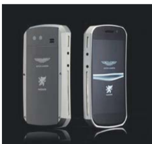
Mobiado Grand Touch Aston Martin

满是珠光宝气的Nexus S会是什么效果?这就是Mobiado Grand Touch Aston Martin想要的效果。这款奢侈智能手机有多种外饰可选,包括蓝宝石和贵金属。 售价:按需定制