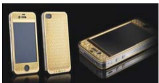
Goldgenie Suvama Bullion iPhone 4S

Goldgenie很擅长在电子产品外表镶嵌贵金属。例如,iPhone 4S外壳可以镶嵌黄金、玫瑰金、铂金以及钻石。这款手机使用的是目前所能制作的纯度最高的黄金贴面。 售价:2.95万美元