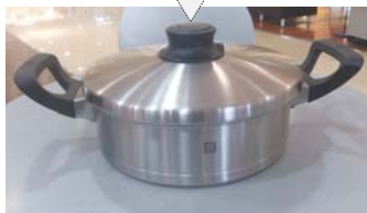
双立人奥林双耳煎炒锅