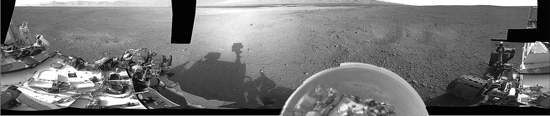
▲这是8月9日美国航天局公布的盖尔陨坑的360度全景图片。