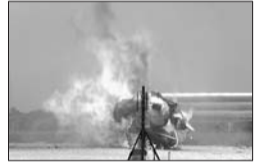
月球着陆器在试飞失败后燃起大火。

据新华社电 美国国家航空航天局一部月球着陆器9日试飞失败,坠落后起火。航天局视频画面显示,着陆器在佛罗里达州约翰·肯尼迪航天中心点火升空,数秒后倾斜并坠落,爆炸起火。着陆器用于航天局摩耳耳斯计划,试验向月球、小行星或其他天体发射低成本着陆器。新型着陆器采用氧和甲烷为燃料,环境污染相对较少,可运载大约500公斤载荷。