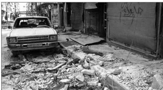
▲9日,在阿勒颇萨拉赫丁区,一辆毁于战火的汽车停在街道上。

当天,叙政府军和反政府武装继续在第二大城市阿勒颇交战。萨拉赫丁区是阿勒颇的“南大门”,双方连日激烈争夺。叙利亚国家电视台9日报道,政府军“特种部队已经在萨拉赫丁区肃清恐怖分子”。反政府“叙利亚自由军”指挥官穆罕默德向法新社记者证实,“我们的人全部