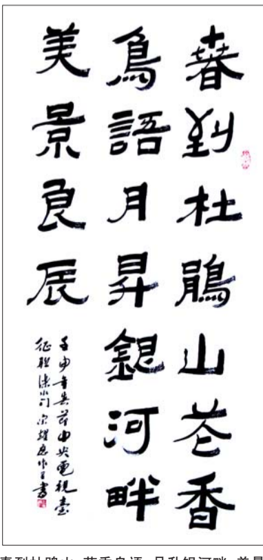
春到杜鹃山,花香鸟语,月升银河畔,美景良辰(获中央电视台征联二等奖)