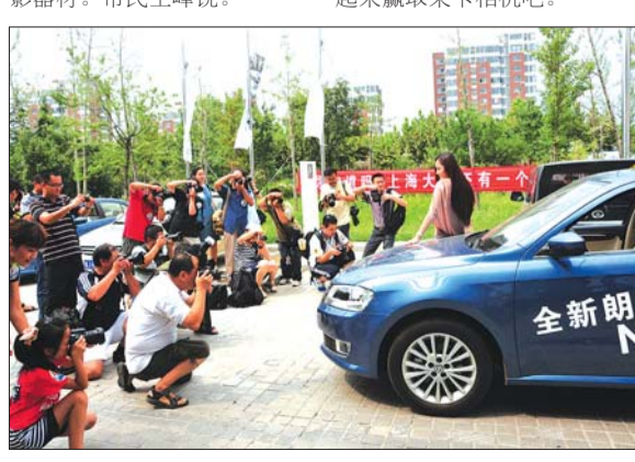
摄影爱好者们拍车拍美女。本报记者 赵苏炜 摄

12日下午1点半,记者来到北方车辆时,已经有不少摄影爱好者来到这里,手中都拿着“长枪短炮”,对着展厅里的新朗逸拍个不停。下午2点,店拍活动开始后,70多位市民和摄影爱好者聚在一起,拍起新朗逸和车模,展厅里响起阵阵快门声。“这次摄影大赛让我们提前一周目睹新朗逸‘芳容’,大家都很高兴,昨天就准备好好摄影器材。”市民王峰说。