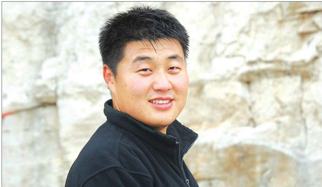
李先生发来自己的照片。