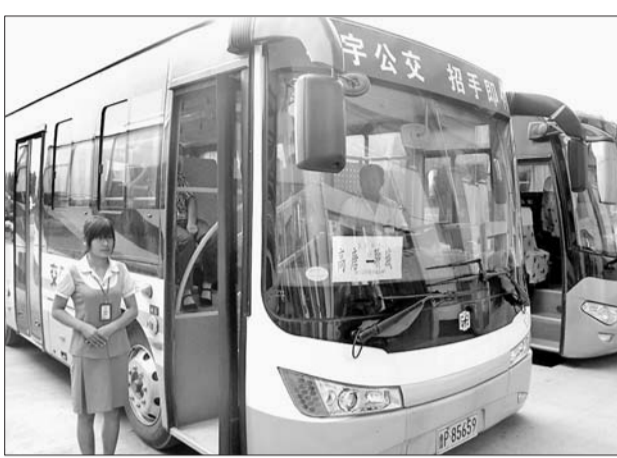
聊城至高唐城际公交10日开通。