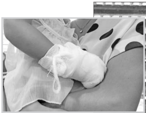
▲小志慧受伤的右手包裹着纱布。