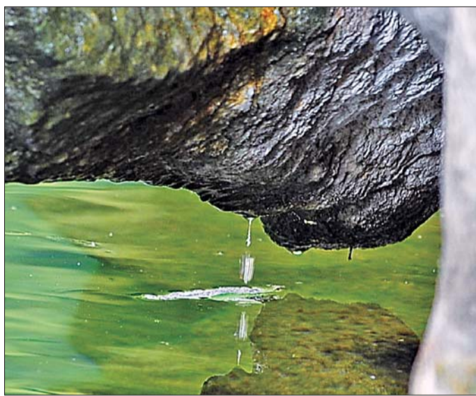
13日,月牙泉开始滴水。

十二名泉中喷涌水位是最高的,月牙飞瀑的出现也标志着省城七十二名泉将全部喷涌。目前只是喷水的前奏,还不能说是完全复涌,游客要想观看月牙飞瀑景观还得等上一段时间。