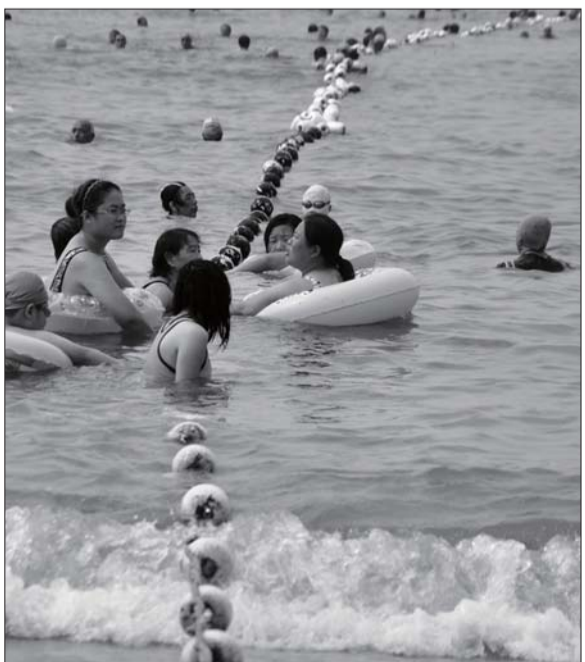
第一海水浴场内的防鲨网不太明显。

“进入旅游旺季，每天车位停满之后，许多等待车位的车辆会将海口路停车场入口堵得死死的，交警来了后会把这些车赶走，找不到车位的司机，只能把车停在海口路路边。”停车场的工作人员说。崂山交警大队民警告诉记者，海口路两侧违法停车的现象一直存在，进入旅游旺季后更加严重，每天最少要贴出200张罚单，交警对这些乱停车的司机大多还是选择劝离的方式。