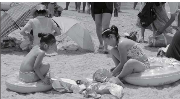
许多游客喜欢在沙滩上边晒太阳边吃零食。

匡明光称，浴场是不允许经营烧烤的。不过因为人手有限，有不法商贩趁着工作人员不注意把摊点摆起来。由于浴场的工作人员没有执法权力，如果遇到类似情况，浴场管理方只有“驱赶权”，并无“查扣权”。