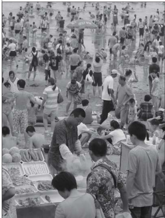
六浴东侧沙滩上的烧烤摊点。

13日，海水浴场及奥帆中心综合整治指挥部副指挥长杨涛告诉记者，根据刚下发的《关于开展海水浴场专项整治的通告》，青岛市将在9月6日前对海水浴场及奥帆中心进行整治，主要针对环境卫生及经营秩序方面出现的问题。按照“先整治、后规范”的原则，青岛市还将出台《青岛市海水浴场管理办法》，确保海水浴场及奥帆中心的管理常态化、规范化。