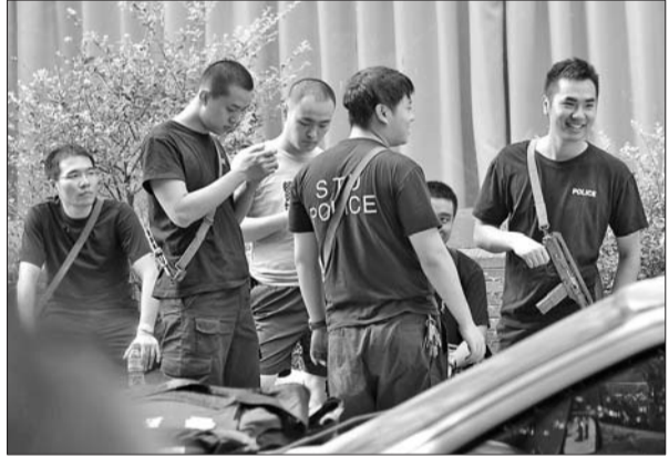
周克华被击毙后，参与追捕的警员们一脸轻松。