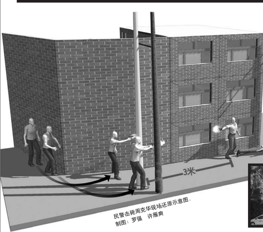
民警击毙周克华现场还原示意图。 制图：罗强 许雁爽