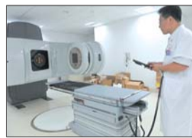
莱州人民医院新进了许多大型设备。

三是数字化管理功能强、效率高。引进国内最先进的数字化医院管理系统,全面优化诊疗流程,减少就诊时间,确保门诊病人候诊时间不超过5分钟。移动查房车、移动护士站大幅度提高工作效率,确保诊疗质量。(本报记者 蒋慧晨 鞠平 张璐)