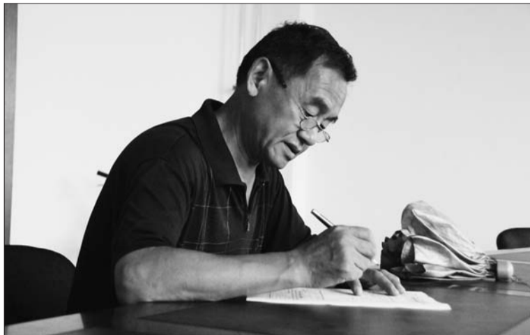
王先生希望借本报相亲会为女儿找到如意郎君。

相亲会报名接近尾声,14日上午,60岁的王先生冒雨来到报社替女儿报名,“她要上班没时间来,我怕再晚就报不上名了,就打着伞赶过来了。”接过报名表,王先生戴上老花镜,认真填写着。