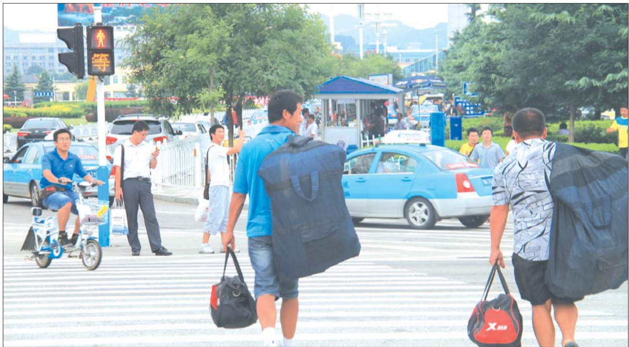
▲上午9时20分许,三名市民同时横穿文化东路。

威海市交警支队宣传科科长李世成对这些行为作了一点评,并表示交警部门将结合创城之机,加大对各类交通违法行为的查处力度。