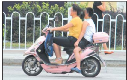
▶中午12时,在汽车站路口,一位摩托车司机自己没有戴安全帽,后面还带着人。