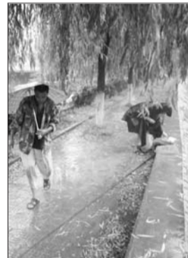
14日,下着雨仍有市民在岸边钓鱼。

水池附近一家商铺的老板告诉记者,发生事故的水池是京福花苑小区的消防蓄水池。2003年,开发商在修建小区的时候一同建起了这个水池。水池西南侧有输水管道,直接连通小区内的消防系统。