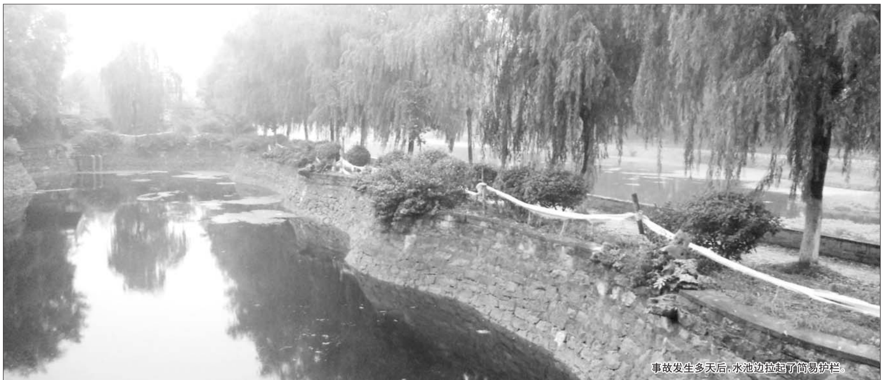
事故发生多天后,水池边拉起了简易护栏。