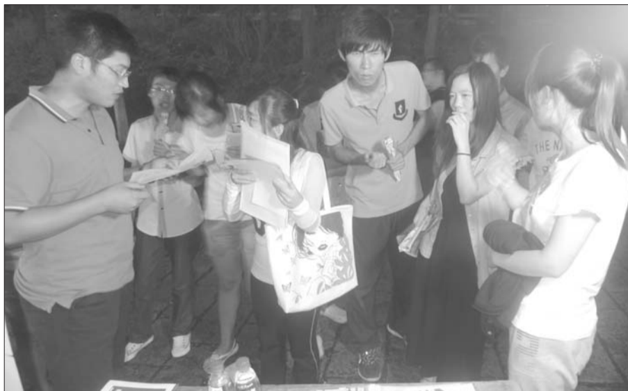
求职者在查看企业招聘信息,并与招聘人员洽谈。

此次招聘企业中不乏冰轮重工、塔山集团、东方海洋、交通银行、和兴产业、苏宁等大型或连锁企业。人才夜市设立了3A诚信企业专区、蓝色海洋经济专区、公益岗位专区、知名企业专区、综合招聘区、大企业宣传区等多个招聘区,参会企业范围覆盖了烟台周边各个县市区。芝罘区人社局设立了大学生创业+技能培训现场报名处,人事代理业务咨询处,劳动法律法规政策咨询处等多个业务咨询处,现场为求职者提供就业创业、保障维权政策咨询服务。