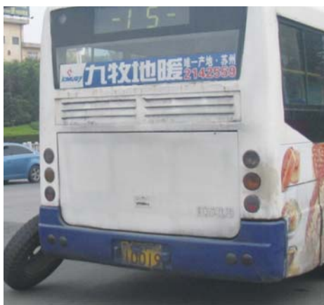
爆胎公交车停在辅道上。

本报967066热线消息(见习记者王永军)“有一辆公交车轮胎爆了,停在路口,交通堵了能有10多分钟了。”16日上午,市民李女士致电本报967066热线,反映北马路汽车站附近一辆公交车突然爆胎。