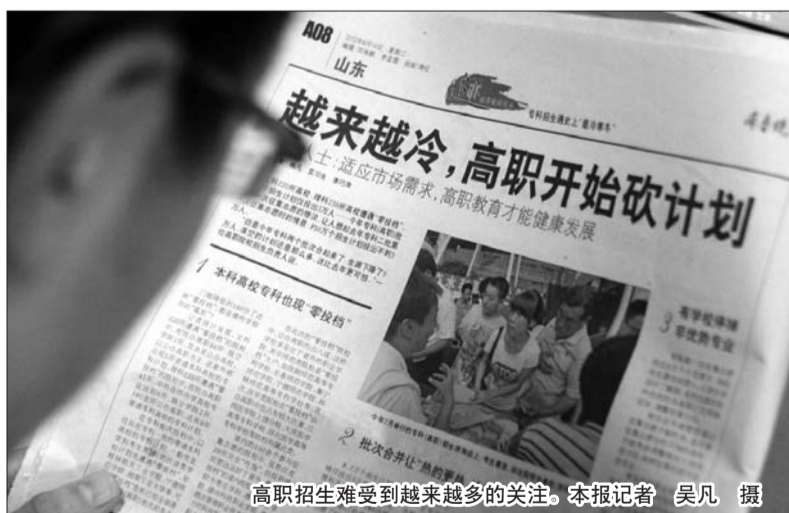
高职招生难受到越来越多的关注。

继续提高录取比例,让更多人接受高等教育,这是大趋势。许多高职院校也意识到了危机,但促进高职教育发展,除了加大投入、加强监督检查外,更重要的是思考如何扎扎实实办好职业教育。