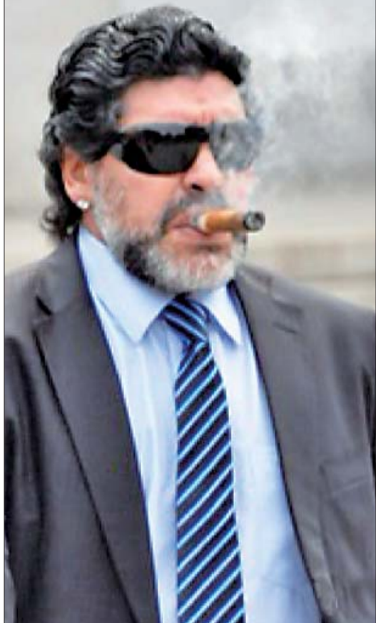
马拉多纳叼雪茄走出法院大门。