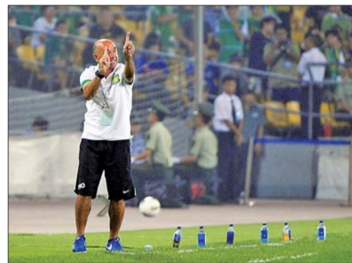
帕切科在场边指挥,情绪激动。

本报讯 8月17日,中超联赛迎来第22轮比赛,北京国安队在主场迎战辽宁宏运队。在上半场比赛临近结束之时,国安队打入一粒进球,结果却被判为越位。这次判罚也引发了国安队以及现场球迷的极度不满,国安主帅帕切科更是显得非常激动、暴躁如雷。很快,慢镜头显示这个球确实不越位,这时国安场边的教练组以及替补球员更加不满,帕切科更是愤怒地摘下了脖子上的证件,准备离开替补席回到休息室,在其他教练员的劝阻下才重新回到场边。