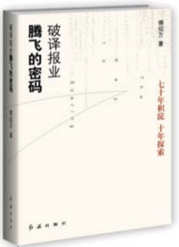
《破译报业腾飞的密码》 傅绍万 著 红旗出版社 2012年6月出版

据有文献记载的酿醋历史至少也在三千年以上，醋在人类生活中扮演着重要角色，是药也是食物。本书作者有着丰富的酿醋经验，在书中对食醋的酿造与营养、如何酿制保健醋以及33种保健醋的材料、做法、浸泡时间、饮用方法、功效、注意事项都进行了详细说明。