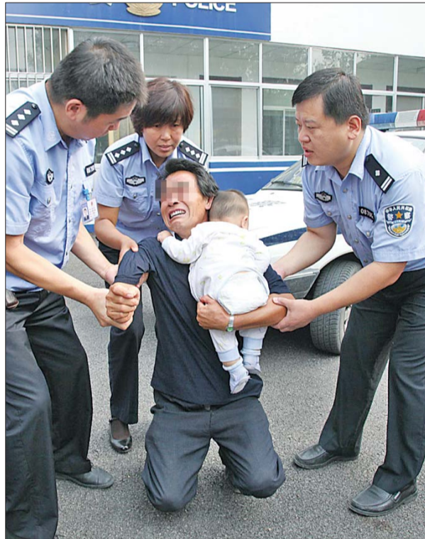
▶从民警手里接过孩子,孩子的爷爷激动得下跪致谢。

目前,涉案的王芳母女、程齐及梁思四名犯罪嫌疑人已被刑事拘留,此案正在进一步审理中。(除民警外,文中所用均为化名)