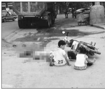
事发现场。