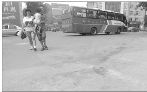
20日上午,在青年路与西大街交叉路口的事发地,还残留着血迹。