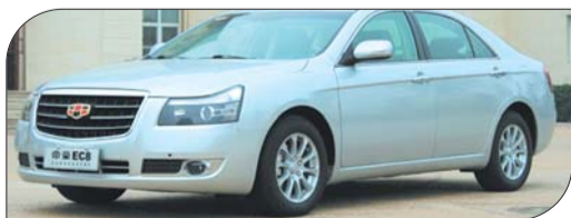
▲帝豪EC8 2.0L 手动舒适导航版