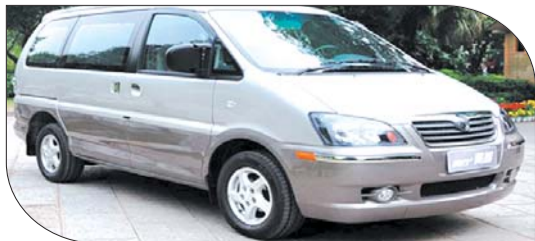
▲菱智V5 2.0L 9座