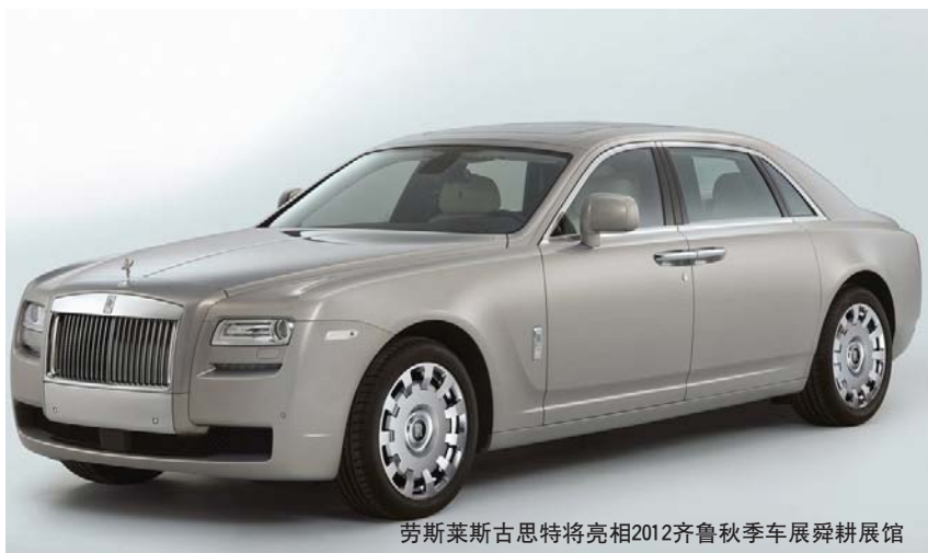
劳斯莱斯古思特将亮相2012齐鲁秋季车展舜耕展馆

今年下半年以来,国内中级车市场开始了换代风潮。其中上海大众全新朗逸、东风日产全新轩逸和北京现代全新朗动作为各自品牌旗下最具代表性的车型,将在齐鲁秋季车展开幕前两个月