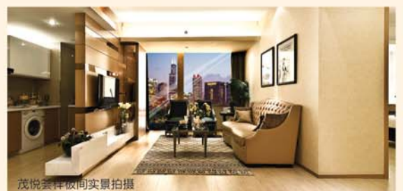
茂悦荟样板间实景拍摄

世茂与Yopark签约，标志着茂悦荟作为济南首家行政私产酒店价值的再次升级，凭借其雄踞泉城路铂金地段，坐享世茂国际广场综合体平台，世茂股份强大的品牌实力，国际品牌精装的品质保障以及世界物业管家Yopark的贴心服务，茂悦荟必将开创济南行政私产酒店市场的新纪元。