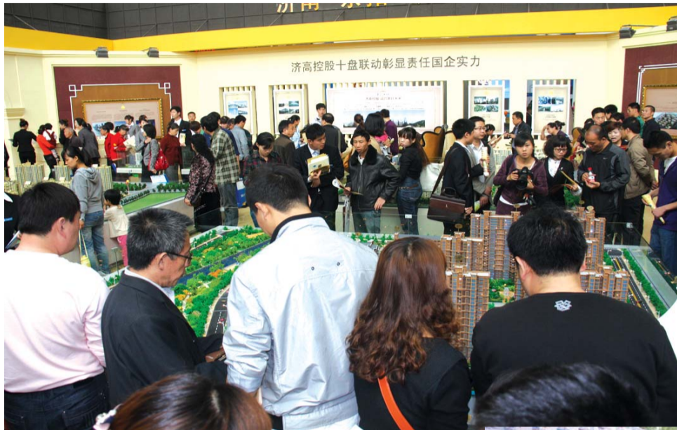
秋季房展能否继燃春季购房热情，我们共同期待！

2012齐鲁秋季房展会招商启动以来，受到业内的高度关注。素有“楼市风向标”美誉的齐鲁房展会是齐鲁品牌楼盘的集中营，亦成为全城市民购房置业的必参之选。据悉，今秋房展会继春季房展会后，将再次为购房者倾力置业优惠，独享省城最高性价比的楼盘。