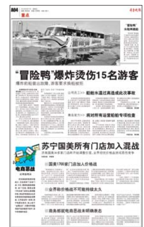
本报曾对此事进行报道。