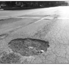
建设路北花园附近路面上的大坑。

调查情况: 振兴路与新纺街路口共有三四处大小不一的坑,有些受损路面还有被切割的痕迹,很明显以前就维修过,只不过现在又坏了。