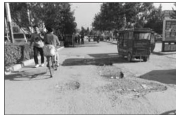
在柳园路非机动车道上,这样的坑洼挺多。

调查情况: 湖西农贸市场前的昌润路路段,几十个坑连成串,紧挨着,周围的路面也是凹凸不平,非常难走。一位司机说,这