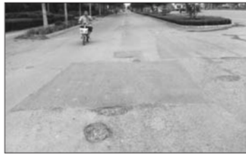
湖南路的非机动车道上有不少小坑。

调查情况: 沿湖南路一路向东走,机动车道上基本没有坑洼,但非机动车道上小坑较多,尤其是在站前街至柳园路段,在