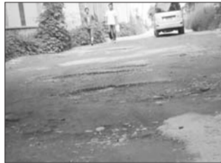
小东关街街口坑洼不平的路面。

调查情况: 在站前街汽车西站附近的一段路,路面明显高于其他地方,而且路面上坑洼不平,有很多坑。一位市民说,这里车辆集中,要是再不修整,这个路面会越来越糟糕。