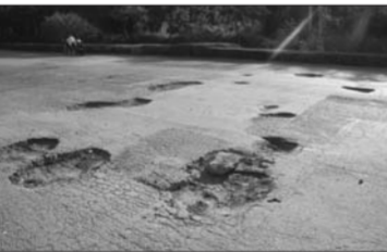
卫育路北段一诺水城龙园附近,坑洼不平的路面。

调查情况: 小东关街连接花园路,柳园路,后菜市街,是条有着20多年历史的石板路,石板间隙用水泥补缝,多处路面已损坏。从花园路进去,小东关街交口处路面已经修补,据附近居民介绍,路面是3个月前修补的,但因为是石板路,只有少部分路面用混凝土覆盖,仍有土质路面露出,道路凹凸不平。小东关街通往鲁西科技广场的街口处,石板路结束,混凝土路面严重损坏,坑洼不平,有大片积水。