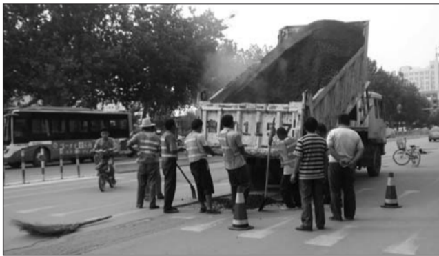
22日,在柳园北路新东方广场附近,工人正在修补路面。 本报见习记者 孟凡萧 摄