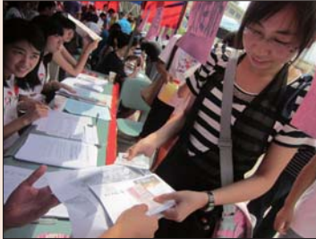
经济学院老生精心为新生准备的一封信。

“学长学姐们想得周到,感觉好温馨啊。”新生小李很激动地说,学长的热情帮助也让她顿时对大学校园生活充满信心。 本报记者 李珍梅