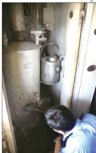
▲乘务员用煤炉为乘客烧开水。

的旅客认为更换空调车后,出行将会更舒适、安全,多花点钱也值。但有些学生和务工旅客认为票价上涨会增加出行成本,还是比较怀念绿皮车时代。