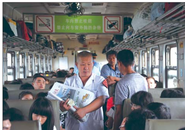
▲乘务员穿梭在狭窄的过道里卖报纸。