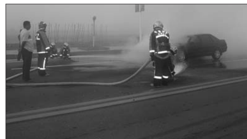
消防官兵用两支水枪在不同方位灭火。

在不同方位灭火。到达现场后,消防官兵发现汽车正在猛烈燃烧,整辆车的前半部分被大火包裹住,声势非常骇人。消防战士们迅速展开行动,经过5分钟的紧张作战,将火势彻底消灭。