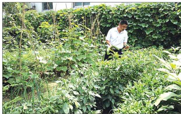
东平农行网点工作人员在小菜园内采摘蔬菜。

近日,农行东平支行在后院开设了菜园,所有员工吃上了自己种的菜。后勤人员和员工下班后,轮着在菜园里拔草、浇田、整地。