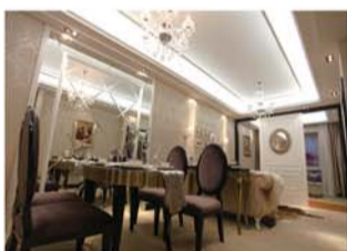
祥泰广场样板间实景图

纯板式LOFT全南向一字排布，大通透、大挑空、大飘窗、大采光、大赠送，60m 2 魔变120m 2 ，享双倍空间，赚双倍租金，额外7m 2 超值附赠。40-80m 2 山景公寓单层户数创济南最少，可拆卸飘窗设计使用面积加倍，地暖、燃气兼得，开创平层公寓享受时代。