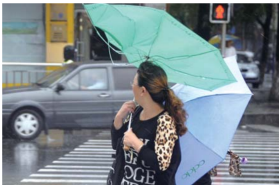
由于风大一些市民的伞被吹了起来。