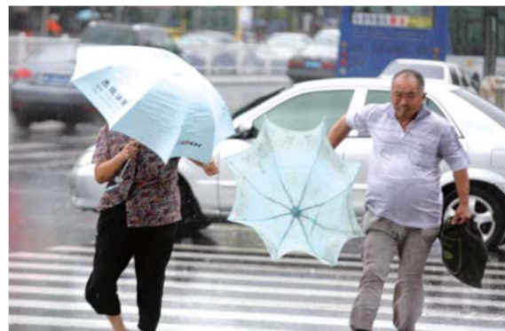
大风夹带着小雨,让人寸步难行。