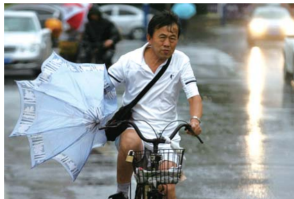
28日上午8点半,烟台市区天色昏暗,风雨交加,因为撑不开伞,一位市民只能冒雨前行。

本报8月28日讯(记者 侯艳艳 通讯员 邓月华) 台风来袭,市区道路的行道树经受着大风的考验,体育公园东门附近一棵5米高的梧桐树被大风吹折了树干。 28日中午,记者在滨海中路烟台体育公园东门附近看到,一棵高大的梧桐树树干折断后横躺在地,由于路面较宽,并未对来往车辆造成影响,这棵梧桐树高约5米,树干粗20多厘米。 市民王女士说,28日上午,滨海中路风势较大,她开车经过时恰好看到这棵梧桐树在大风中摇摆,记者随后在滨海中路看到,今年新栽植的树木由于设置了支撑加固处理,并没有受大风影响,仅有极少数的绿化带树木被吹歪。 烟台市政管局园林处绿化科负责人介绍,体育公园东门附近栽植的梧桐树并非园林处管理,工作人员将通知相关部门处理。