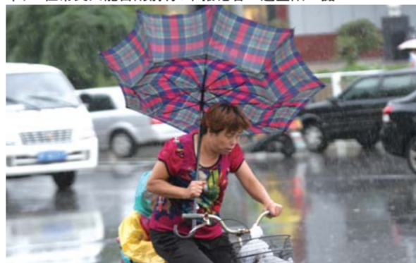
西南河路上,一位母亲打着伞被刮翻。