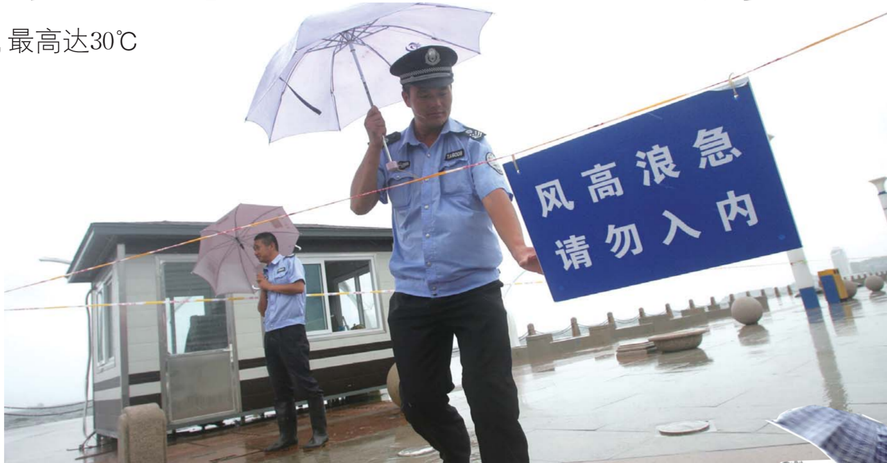
受台风“布拉万”影响,滨海广场拉起警戒线,禁止游人入内。

降雨量和风级都要比预报值偏低。 吴树功称,北上台风强度通常为减弱趋势,极个别的会出现加强,台风“布拉万”形成后北上呈加强趋势,但27日就已经由超强台风减弱为强台风,28日凌晨降为台风,台风强度减轻,加上路径偏东,才使其对烟台的影响减小,这与烟台的地形关系不大。