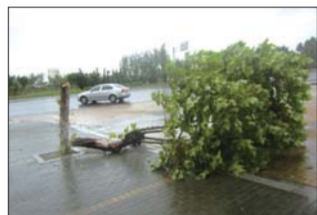
滨海中路体育公园东门附近,一棵梧桐树被大风折断。