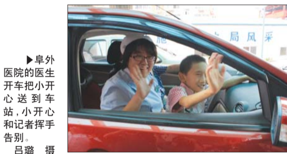
阜外医院的医生开车把小开心送到车站,小开心和记者挥手告别。