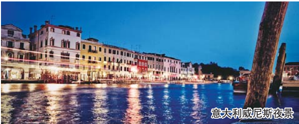
意大利威尼斯夜景

意大利气候温暖,四季鲜明,一年四季都充满了魅力。春天适合欣赏艺术、历史及文化;夏天的海滨沙滩是最美丽的了,洗海水浴的最佳时间是6月下旬到9月上旬,7—8月则可能欣赏到维也纳和罗马等地举行的野外歌剧和音乐会。秋天是欣赏艺术、探访历史遗迹的好时节;冬天可以享受滑雪的快乐,各地也纷纷上演歌剧。