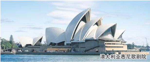
澳大利亚悉尼歌剧院

阳光、海滩、广袤的内陆,茂密的雨林、绝美的大堡礁、独一无二的袋鼠和考拉、昆士兰的黄金海岸,迷人的城市和友好的多元文化社会,以及热情而舒适的人文环境,对于全世界的游客来说,都是不可抵挡的诱惑,逐步富裕起来的中国人也不能例外。