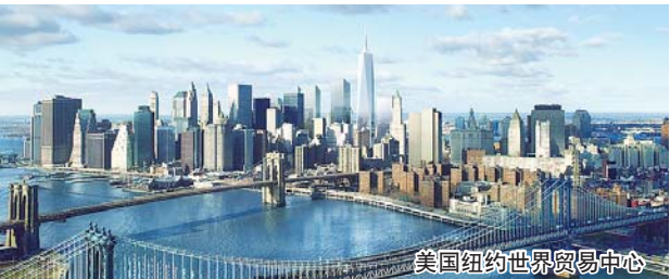
美国纽约世界贸易中心

美国有丰富的旅游资源,也是一个旅游业非常发达的国家,科罗拉多大峡谷的雄伟,尼亚加拉大瀑布的气势,好来坞的浪漫,迪斯尼乐园的轻松,赌城拉斯维加斯的辉煌等等都令人神往不已。美国地域广阔,横跨多个气候带。