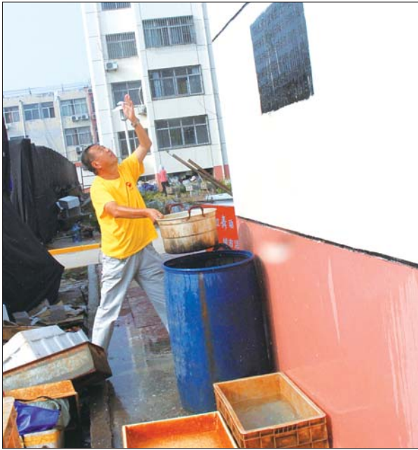
见自来水白白流失怪可惜,盖女士把大桶放在楼下接水。