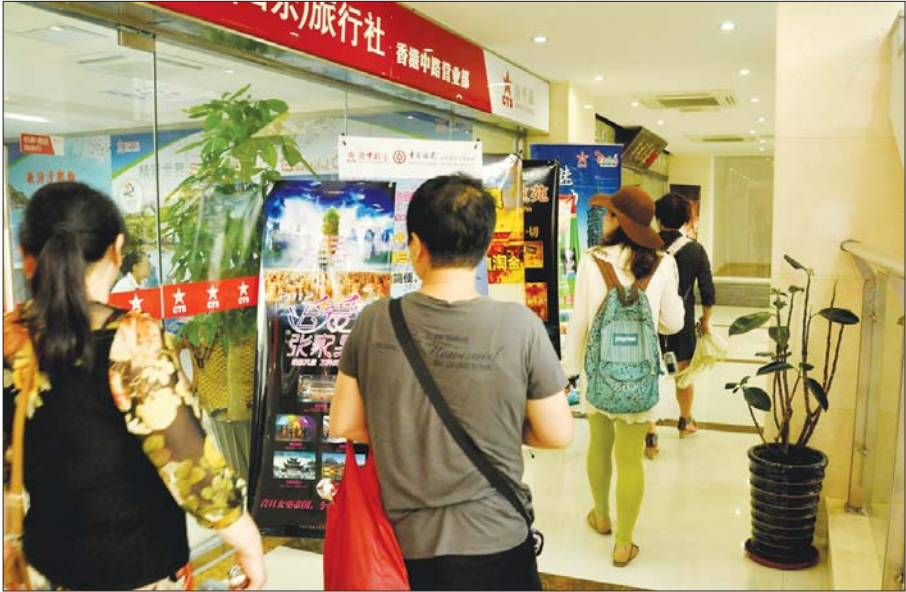
不少顾客前来旅行社询问价格,为“十一”出游提前做准备。

项目依旧是大多数游客的选择,目前,日韩游的“十一”报价在4000元左右,新马泰游报价在6000元左右。 刘念分析,往年“十一”期间推出的欧洲出境游路线比较少,与交通不便也有一定关系,之前去欧洲地区都得到北京乘坐飞机,机票也很难订,因此境外游线路在往年不太受宠。“今年,青岛机场开通了飞法兰克福的航线,不少境外目的地都可以从青岛乘飞机抵达,这对青岛的出境游项目的推广也是一个巨大推动。”因此,旅行社在今年“十一”黄金周的境外游项目上格外费心,从目前参团人数上来看,也很受追捧。