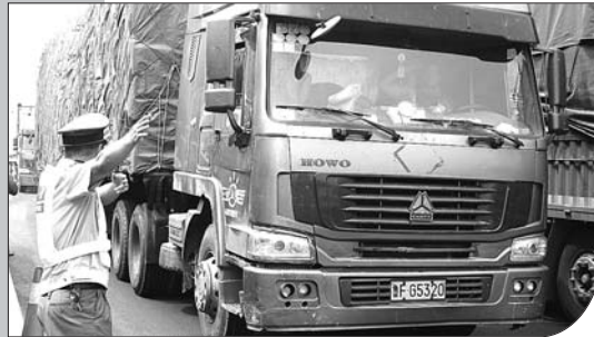
路政人员在事故现场疏导车辆。