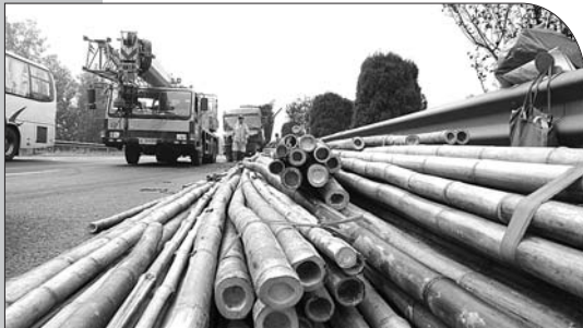
一辆满载竹竿的大货车与一辆半挂车相撞,竹竿散落一地。