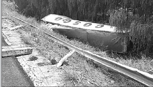
一辆烟台籍的集装箱半挂货车侧翻在边沟内,近30吨冷冻鲈鱼散落在路沟。