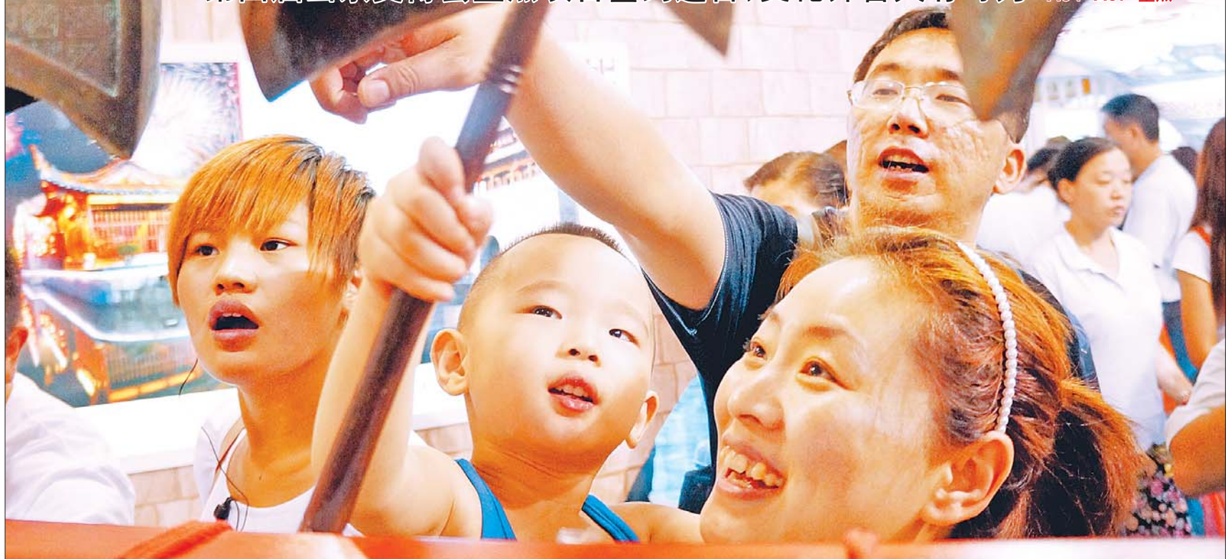
9月3日,第四届山东文博会闭幕,现场参观人次达到26万。图为一名儿童敲响编钟。