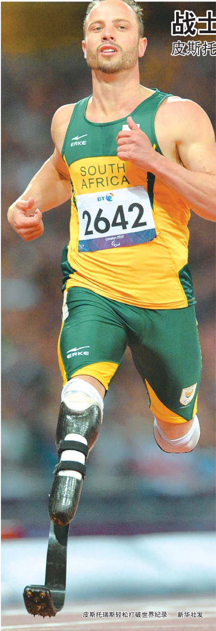
皮斯托瑞斯轻松打破世界纪录。