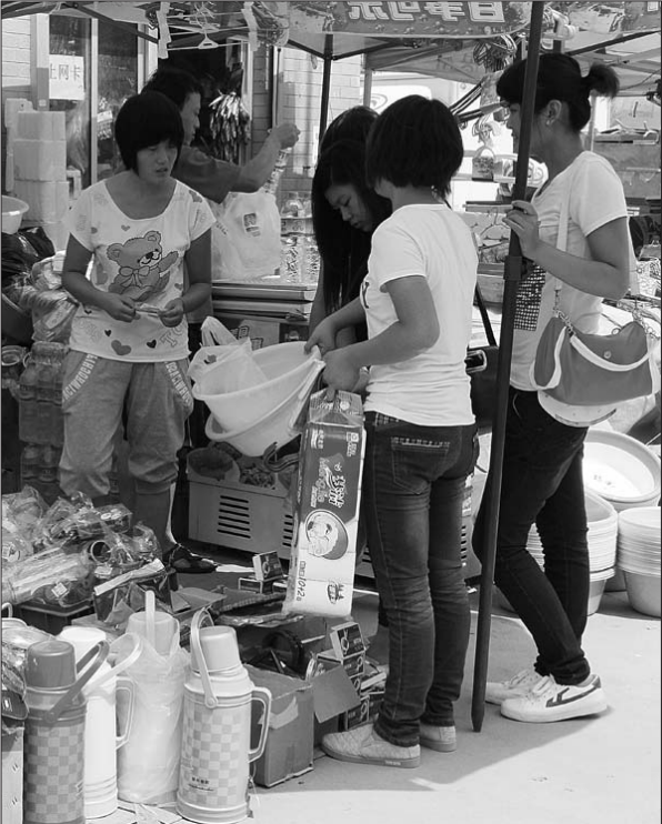
前来购买日用品的学生络绎不绝。

西这么齐全就不带那么多了。” 学校周边的部分饭店也打起了“欢迎新同学,喜迎新朋友”的标语,记者注意到,就餐的顾客中不少是一家三口和三俩同学结伴的身影。该老板表示,每年到这个时候都会打出温情标语,希望可以为学生和家营造好的就餐环境。记者从附近的宾馆了解到,最近两天几乎家家爆满。“因为紧靠学校,暑假时宾馆也会跟着学生一起放假,这两天随着学生返校及送学生家长的入住,宾馆生意也会跟着好起来。”老板王女士对记者说。 “一看黑板才知道原来的眼镜度数低了,重新给我测下吧。”在眼镜店里,记者见到了好几个前来更换镜片的学生。眼镜店的工作人员称,近来配眼镜的比平时多一倍左右,70%是学生。