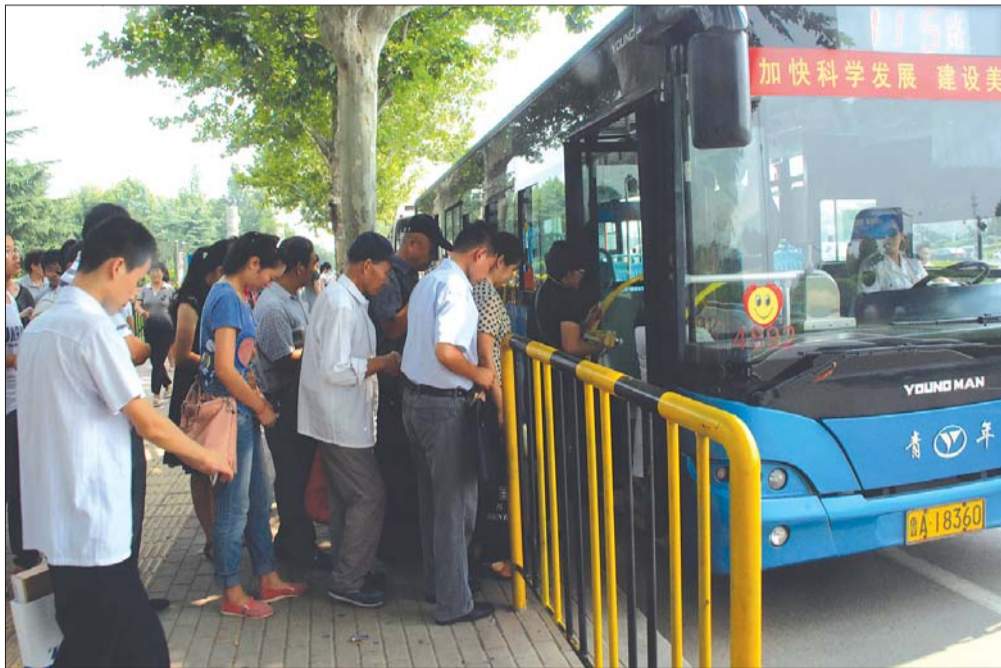
众多。图为邢村立交桥始发站。

本报9月3日讯(记者戚淑军) 公交车里已经塞得满满当当,可后面乘客还是见缝插针往里挤,车里乘客牢骚满腹,车外乘客心急火燎,上下班时间,在公交115路路上这样的场景屡见不鲜。近日,记者在115路路上采访发现,乘客多,车辆少,路线长,间隔时间不尽合理,让乘客叫苦不迭。 “赶紧呼呼呼呼吧,115路公交车实在太挤了。”近日,市民孙女士向记者反