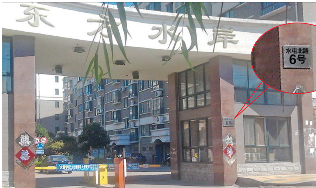
东方水岸小区位于东泺河路上,但是门牌上却写着“水屯北路6号”,这给业主们带来了不少麻烦。

本报9月4日讯(记者 陈伟) 近日,天桥区东方水岸小区居民向本报反映说,小区正门在东泺河路上,但是门牌上却是“水屯北路”,导致物流、快递经常找错地,给居民带来了不少麻烦,希望相关部门能够给予更正。