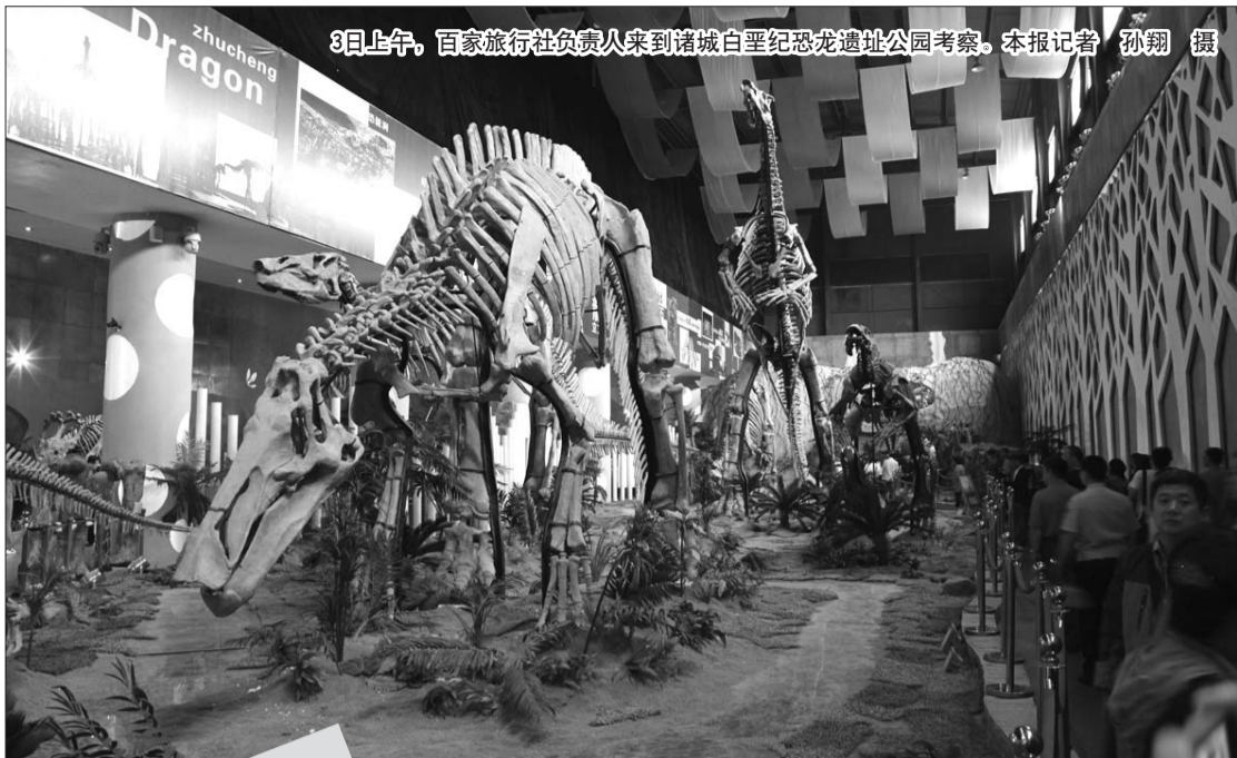
3日上午,百家旅行社负责人来到诸城白垩纪恐龙遗址公园考察。