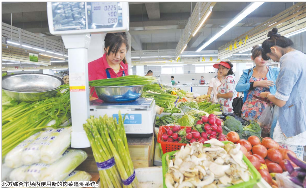
北方综合市场内使用新的肉菜追溯系统。