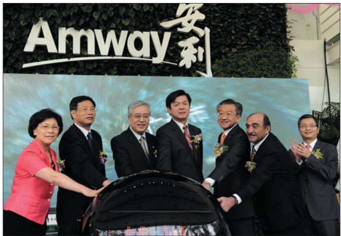
广州市副市长贡儿珍、广州市委常委凌伟宪、广东省政协副主席徐尚武、安利大中华区总裁颜志荣、安利(中国)总裁黄德荫、华南美国商会会长哈里及安利大中华区营运总裁侯德伟(从左至右)共同启动亮灯仪式。

2012年9月4日,安利(中国)日用品有限公司与广州经济技术开发区在广州举行增建第二生产基地签约仪式。安利(中国)总裁黄德荫宣布,为了进一步提升安利(中国)的生产和研发能力,安利决定增加投入6亿元,在广州经济技术开发区新建第二生产基地,并在江苏无锡建设安利(中国)植物研发中心。